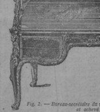
Fig. 2. — Bureau-secretaire du roi Louis XV, commencé par Odden et achevé par Riesener (Musée du Louvre.)