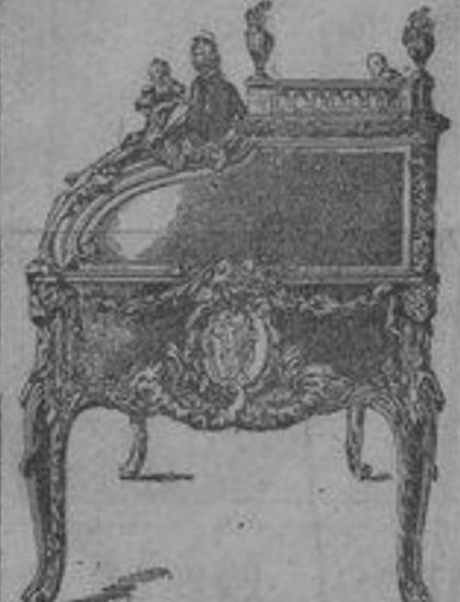
Fig. 2. — Bureau du roi Louis XV, par Odden et Riesener (Musée du Louvre.)