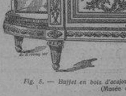
Fig. 5. — Buffet en bois d'acajou et d'amarante, par G. Beneman. (Musée du Louvre.)