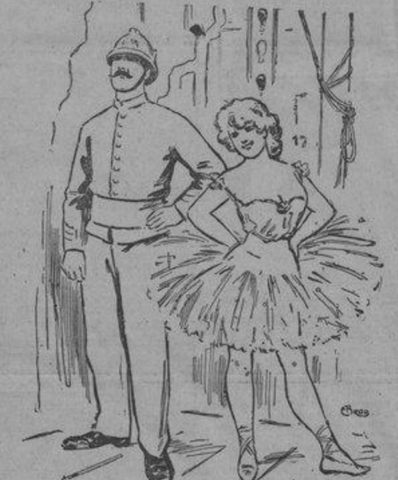
Le Pompier de Service