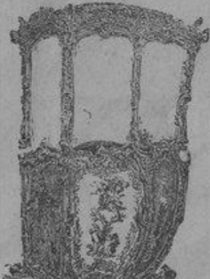
Fig. 1. — Chaise à porteur en vernis Martin, Epoque de Louis XV.

vent assemblés par la collaboration de Eben et de Riesener. Riesener sera l'ébéniste du style Louis XVI, son œuvre sera continuée par Beneman, son élève.